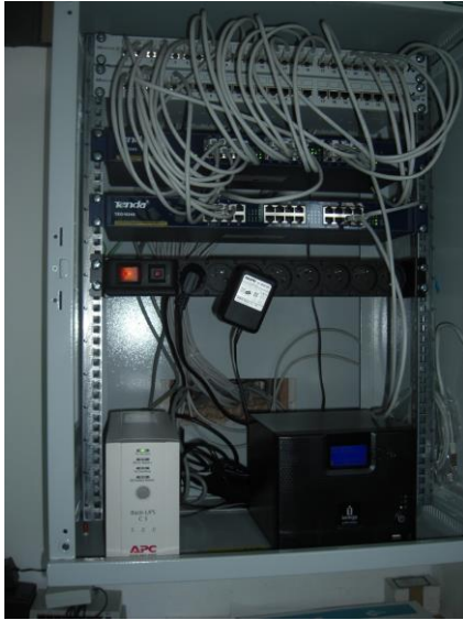
záložný zdroj, dátový rozvádzač